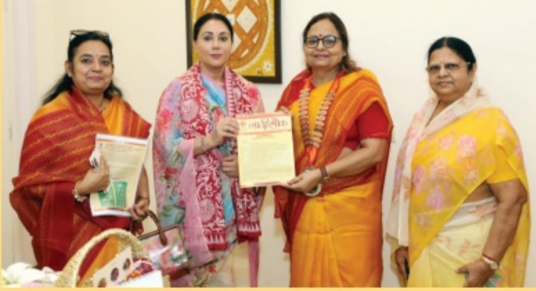
राजस्थान की उपमुख्यमंत्री श्रीमती दीया कुमारी के साथ